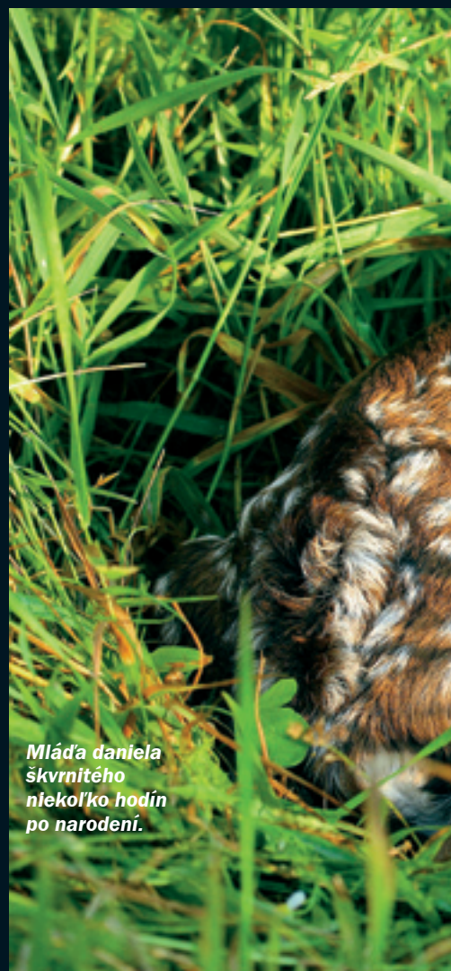
Mláďa daniela škvrnitého niekoľko hodín po narodení.

Vodcovskú pozíciu v čriede získavajú jedince so silným a lopatovitým parožím.